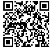
1. 农业农村权力事项清单