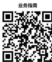
12.兽药经营许可证核发

https://zwfw.fushun.gov.cn/fszww/epointzwmhwz/pages/legal/personaleventdetail?taskguid=18a4d4bc-a487-496e-a02a-ab9924a10468